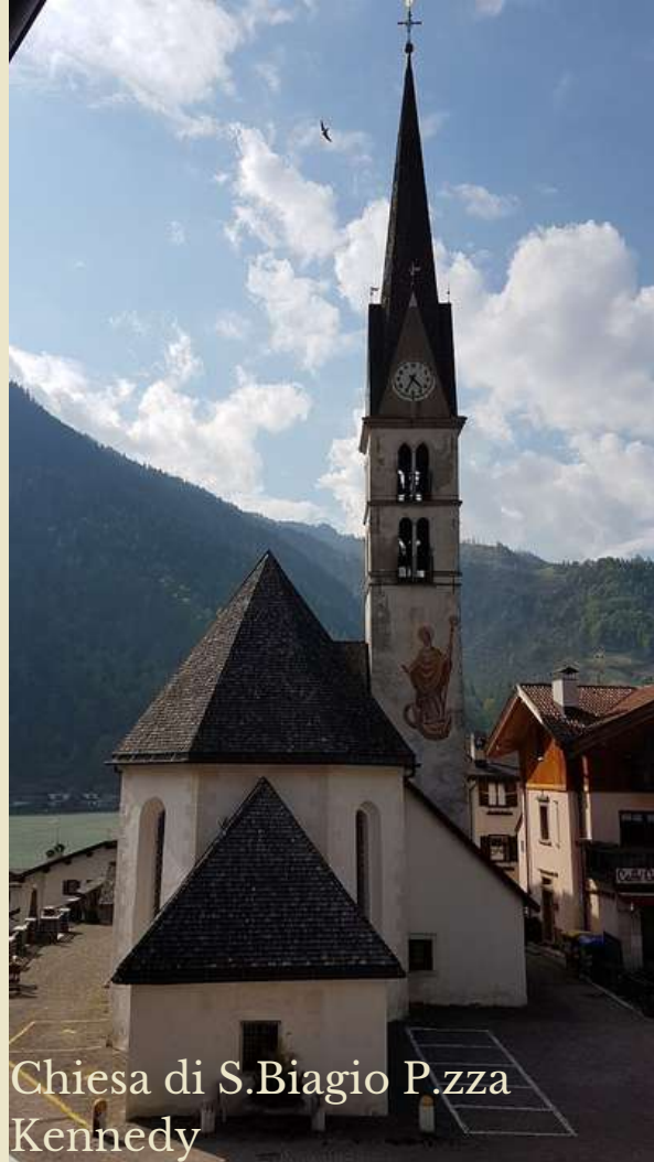
Chiesa di S.Biagio P.zza Kennedy

Lago di Alleghe Intersezione Ru Della Vizza. Da Masarè verso la foce del Cordevole lungo la stradina che costeggia la dx orografica del Lago. Grandiosa vista sul paese e Monti Coldai e Civetta. Coordinate: 46°24'37.47"N - 12° 0'46.19"E